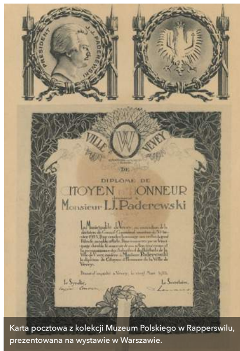
Karta pocztowa z kolekcji Muzeum Polskiego w Rapperswilu, prezentowana na wystawie w Warszawie.

Prezentowane na wystawie obiekty zostały starannie wyselekcjonowane spośród