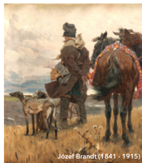
Józef Brandt (1841 - 1915)