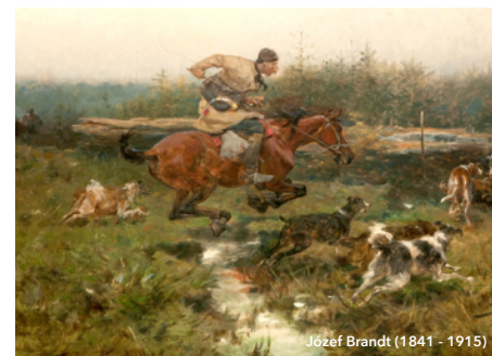
Józef Brandt (1841 - 1915)