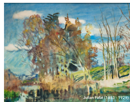
Julian Fałat (1853 - 1929)