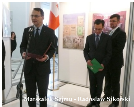
Marszałek Sejmu - Radosław Sikorski

5 lutego 2015 r. w Sejmie RP odbył się wernisaż wystawy "Zbiory Muzeum Polskiego w Rapperswilu".