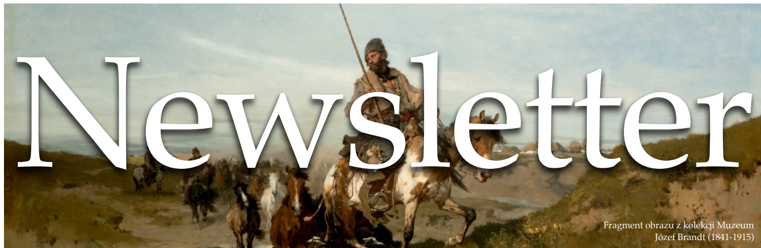
Fragment obrazu z kolekcji Muzeum Józef Brandt (1841-1915)

Aktualności, ogłoszenia i wydarzenia w Muzeum Polskim w Rapperswilu. Zapraszamy do zapoznania się z naszym newsletterem.