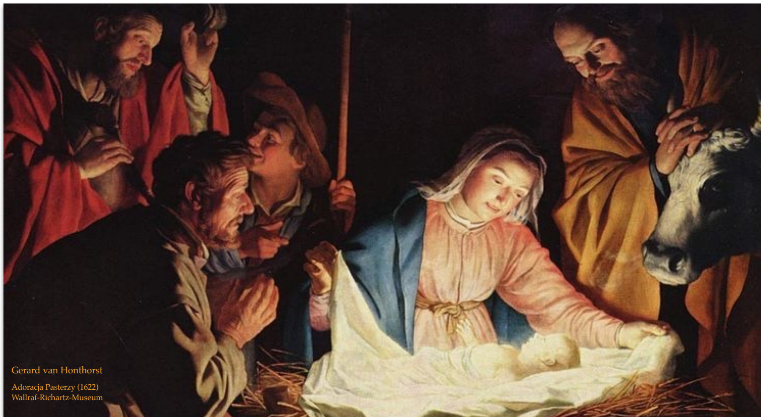
Gerard van Honthorst Adoracja Pasterzy (1622) Wallraf-Richartz-Museum

Zarząd Towarzystwa Przyjaciół Muzeum oraz pracownicy Muzeum Polskiego w Rapperswilu dziękując za okazaną nam życzliwość składają najlepsze życzenia z okazji Świąt Bożego Narodzenia oraz nadchodzącego Nowego Roku 2015.