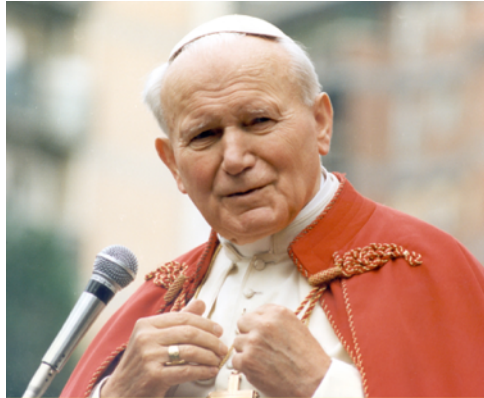
NAUCZYCIEL WIERZĄCEGO ROZUMU. JAN PAWEŁ II A WSPÓŁCZESNOŚĆ.

Wystawa Kardynał Adam Kozłowiecki SJ „Z otwartymi dłońmi” przygotowana została przez pracowników rzeszowskiego oddziału IPN-u. Powstała we współpracy z Fundacją im. ks. Kardynała Adama Kozłowieckiego „Serce bez granic”, Urzędem Marszałkowskim Województwa Podkarpackiego oraz Powiatem Kolbuszowskim. Wystawa przedstawia osobę i działalność ks. Kardynała Adama Kozłowieckiego z uwzględnieniem osobistych przeżyć oraz działalności duszpasterskiej, społecznej i politycznej, jak również pokazuje formy pielęgnowania pamięci o „człowieku, którego docenił świat”.