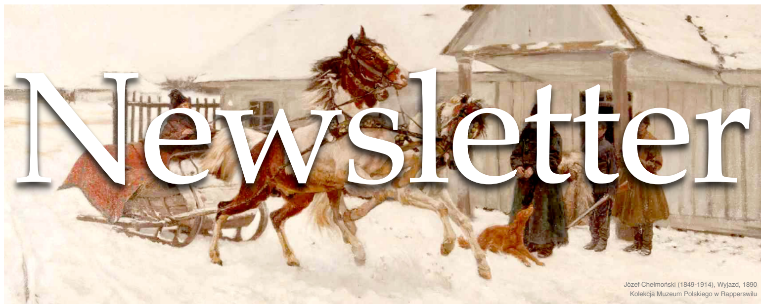
Józef Chelmoński (1849-1914), Wyjazd, 1890 Kolekcja Muzeum Polskiego w Rapperswilu

Aktualności, ogłoszenia i wydarzenia w Muzeum Polskim w Rapperswilu. Zapraszamy do zapoznania się z naszym Newsletterem.