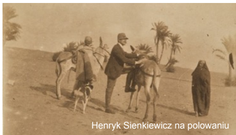
Henryk Sienkiewicz na polowaniu

W Stanach Zjednoczonych brał udział w polowaniu na szare niedźwiedzie (okolice hrabstwa Los Angeles) i na zaproszenie myśliwych z San Francisco na bawoły (kanion górnego biegu rzeki North Platte). Podróż do Stanów finansowana była przez „Gazetę Polską” w zamian za korespondencję z podróży, która była umieszczona w gazecie („W listach Litwosa z podróży”- 1876-1878, wyd. G. Pol. osobno wyd. 1880 r.).