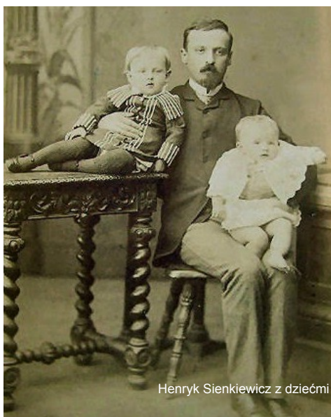
Henryk Sienkiewicz z dziećmi