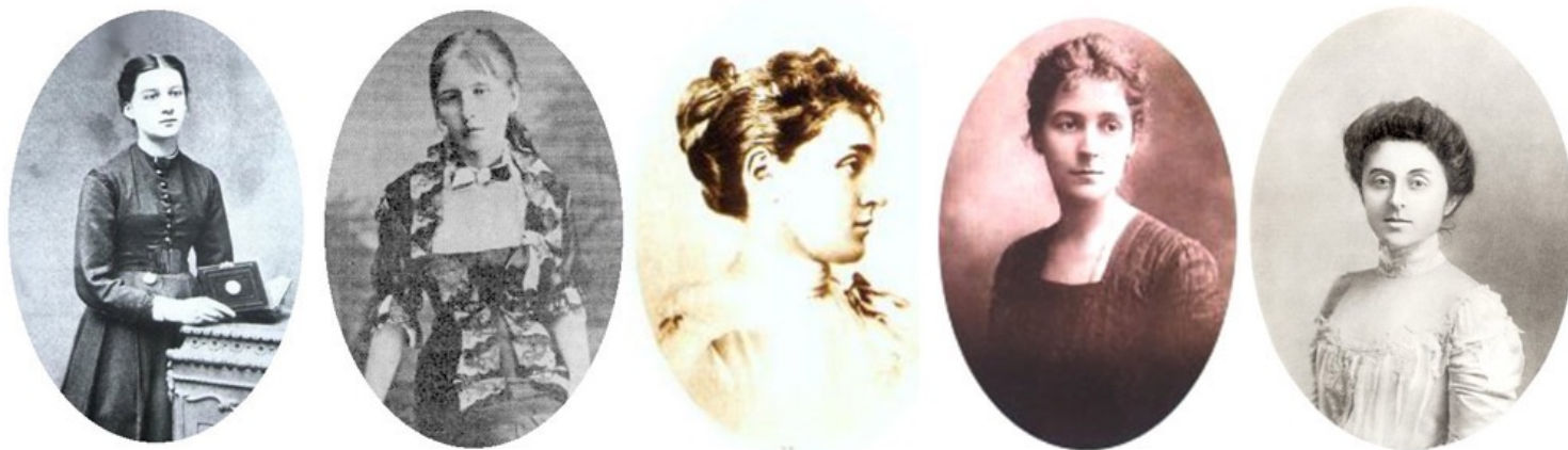
Marie Henryka Sienkiewicza (od lewej): Kellerówna, Szetkiewiczówna, Wołodkowiczówna, Radziejewska, Babska